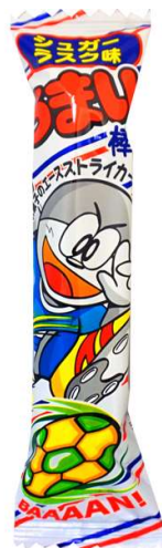
うまい棒 : 駄菓子, お菓子の通販 | 卸問屋 ミカミオンラインショップ ( dagashi-ya.jp )