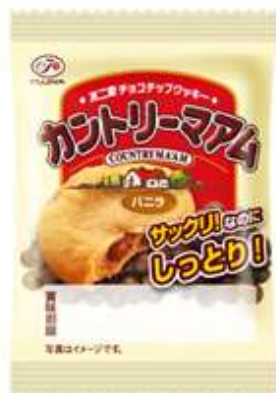
不二家 1枚カントリーマアム(バニラ)(不二家) ( aoigangu.com )