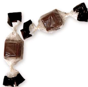
アルファベットチョコレート | 名糖産業株式会社 ( meito-sangyo.co.jp )