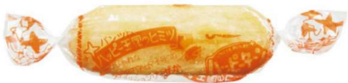
亀田製菓 ハッピーターン | カウネット ( kaunet.com )